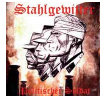
ILLUSTRATION: STAHLGEWITTER: POLITISCHER SOLDAT, PC RECORDS 2002

Das Album „Germania über alles“ (Stahlgewitter 2003) stellt den „nationalen Widerstand“, d. h. den organisierten deutschen Neonazismus, in die Traditionslinie der „Wehrmachtsoldaten“, und im Song „Meine Knochen könnt ihr brechen“ gehen die Vorstellungen, Opfer von Repression und staatlich organisierter Gewalt zu sein, Durchhalteparolen und Vergeltungsphantasien eine intime Verbindung ein: „Wir oder ihr, das wird sich entscheiden, ihr werdet dieselben Qualen erleiden. Am Tag C, wenn unser Schlachtruf gellt, mal sehn, wer sich uns dann noch entgegen stellt. Nur der Sieg, heißt nur noch unser Gebot, denn auch wir sind lieber tot als rot. Meine Knochen könnt ihr brechen, meinen Glauben nicht. Mein Wille ist unantastbar, ich spuck euch, ich spuck euch ins Gesicht.“ 28 Auf „Braun ist Trumpf“ der Gigi und Die braunen Stadtmu-