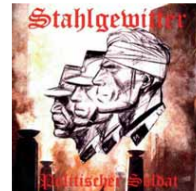
ILLUSTRATION: STAHLGEWITTER: POLITISCHER SOLDAT, PC RECORDS 2002

Das Album „Germania über alles“ (Stahlgewitter 2003) stellt den „nationalen Widerstand“, d. h. den organisierten deutschen Neonazismus, in die Traditionslinie der „Wehrmachtsoldaten“, und im Song „Meine Knochen könnt ihr brechen“ gehen die Vorstellungen, Opfer von Repression und staatlich organisierter Gewalt zu sein, Durchhalteparolen und Vergeltungsphantasien eine intime Verbindung ein: „Wir oder ihr, das wird sich entscheiden, ihr werdet dieselben Qualen erleiden. Am Tag C, wenn unser Schlachtruf gellt, mal sehn, wer sich uns dann noch entgegen stellt. Nur der Sieg, heißt nur noch unser Gebot, denn auch wir sind lieber tot als rot. Meine Knochen könnt ihr brechen, meinen Glauben nicht. Mein Wille ist unantastbar, ich spuck euch, ich spuck euch ins Gesicht.“ 28 Auf „Braun ist Trumpf“ der Gigi und Die braunen Stadtmu-