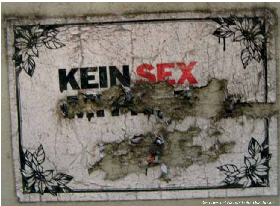
Kein Sex mit Nazis?

Wir sind es gewohnt, hinsichtlich aller Umstände und Handlungen des Dritten Reichs in Superlativen zu denken und zu argumentieren. Die Shoah ist das schlimmste aller Verbrechen in der Weltgeschichte, der Zweite Weltkrieg das größte Morden, die Gleichschaltung die äußerste Form der Diktatur, die Ideologie des Nationalsozialismus die unmenschlichste und grauenhafteste aller Verirrungen, das menschliche Denken je hervorgebracht hat. Jede Form der Differenzierung oder Relativierung wird zumindest im öffentlichen Diskurs hart angegangen und meistens sanktioniert. Im Kern ist das Auftreten gegen den Rechtsextremismus heute getragen von der politischen Absicht, solches Grauen, solches Verbrechen, solche Schuld nie wieder zuzulassen.