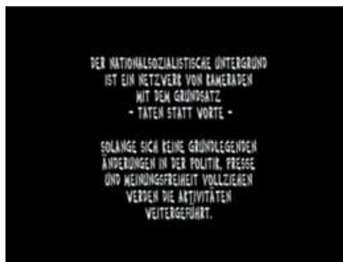
Imperativ des politischen Soldaten: Taten statt Worte. Screenshot vom Bekennervideo des „Nationalsozialistischen Untergrunds“ / NSU.

2010 besang Giese auf dem Album „Adolf Hitler lebt!“ (Gigi & Die braunen Stadtmusikanten 2010) in