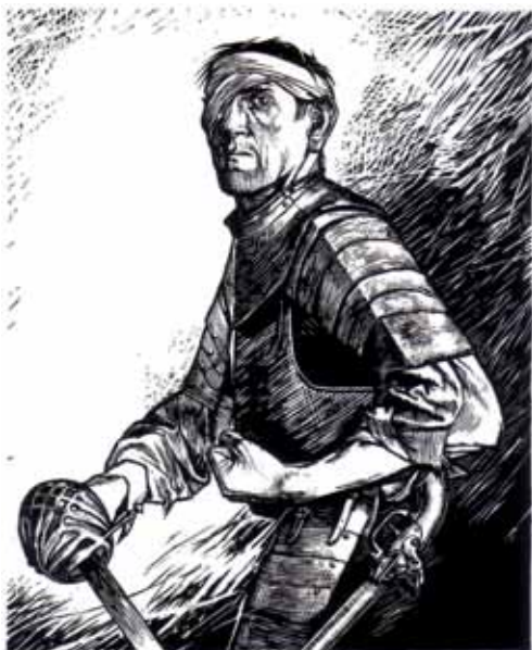
Ein Pfad dem Mann, der sich nicht wehren kann. / Tot lehrt das Gebot: Schlach! Tot, schlach! Tot.

Dem rohesten Affekt ein Denkmal setzen: In zigfachen Variationen inszenierte der NS-Grafiker und Maler Georg Sluiterman van Langeweyde (1903 - 1978) das spezifisch nationalsozialistische Bild vom (politischen) Soldaten und transportierte es in Form von Bauern- und Arbeiterportraits in den zivilen Alltag (S. 29). Langeweydes Arbeiten gehören heute noch zu den bei Neonazis beliebtesten Motiven. Die vorliegende ILLUSTRATION wurde dem Neonazi-Zine NORDWIND, Nr. 2 / 2005, S. 18, entnommen.